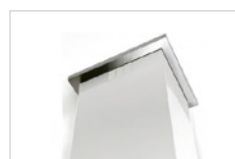
Embellecedor a techo Ceiling trim Ref. 7118

KIT (1*): Precio KIT suministrado con la campana / RSP KIT ordered together with the hood KIT (2*): Precio KIT suministrado posterior a la campana / RSP KIT ordered individually