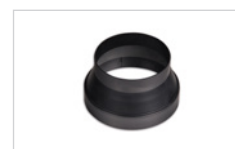
Incluye Aro reductor de serie Includes reducer ring as standard Ø150 a Ø120 mm